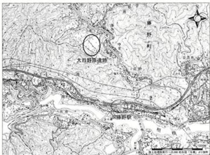
大日野原遺跡とJR藤野駅位置